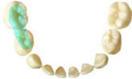
2 下顎右側乳歯の奥歯の物を噛む面